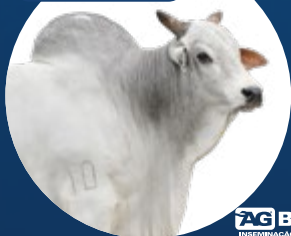
5155 da EAO